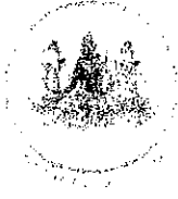
กระทรวงแรงงาน