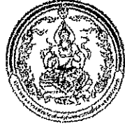
กระทรวงการพัฒนาลังคม และความมั่นคงของมนุษย์