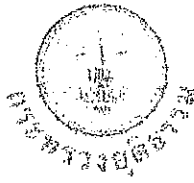
กระทรวงยุติธรรม