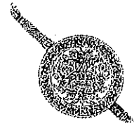
สำนักงานตำรวจแห่งชาติ