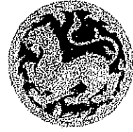
กระทรวงมหาดไทย