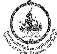
กระทรวงดิจิทัลเพื่อเศรษฐกิจ และสังคม